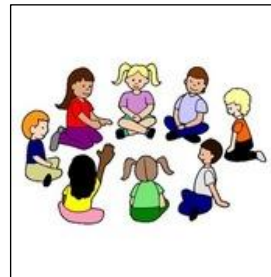
Wie het goed heeft geraden is daarna aan de beurt.