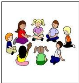
Ga met twee spelers tegenover elkaar zitten en met meer spelers in een kring. Om de beurt zet iemand zijn eigen schoenen voor zich neer.