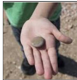
Pak het steentje en hou het in je hand.