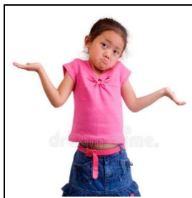
Om je tegenspelers te foppen ga je nog even door met het bewegen van je armen zodat je niet goed kunnen zien in welke schoen het steentje zit.

https://hdl.handle.net/20.500.11840/734201