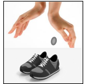
Beweeg je handen snel boven je schoenen en laat het steentje -zo onopvallend mogelijk- in één van je twee schoenen vallen.